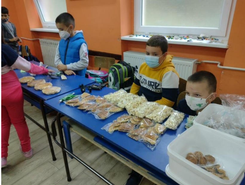
Дечји вашар одржан је у просторијама школе