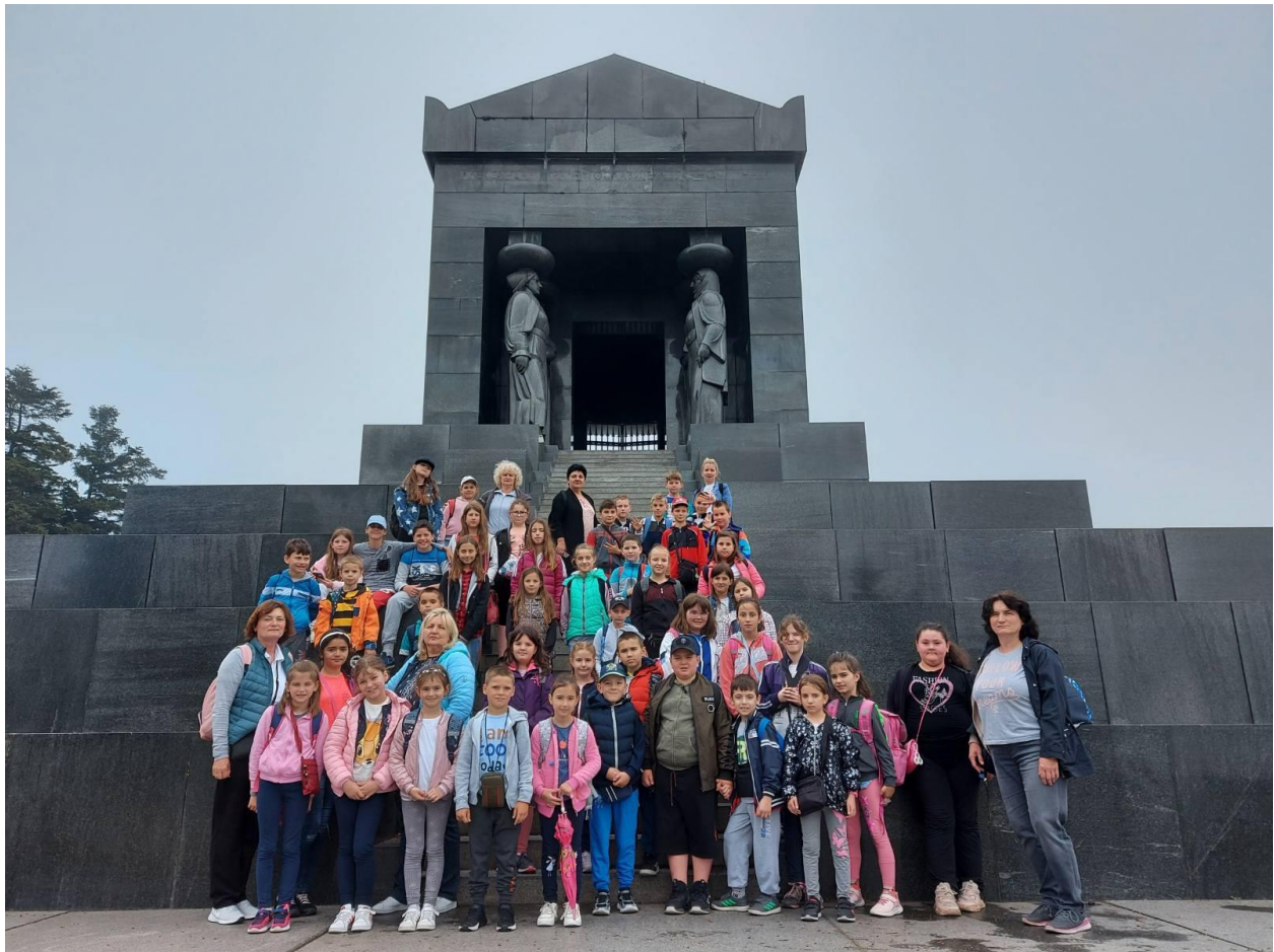
Испред споменика Незнаоом јунаку на Авали.

Екскурзија -нижи разреди Бочар-Београд, 28. мај 2022.